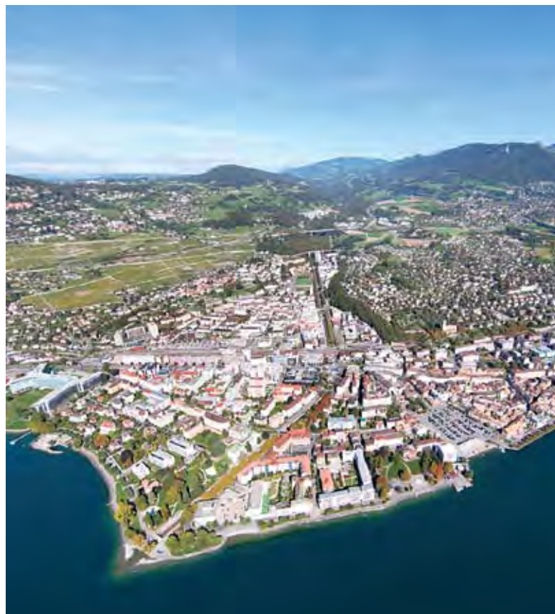
L'enjeu est de maintenir Vevey comme le centre majeur de l'agglomération en lui donnant une densification de qualité et une bonne accessibilité. Paysagegestion

Une autre partie de ce volet est consacrée à Vevey-Ville où, selon l'étude, il n'y a pas de problèmes majeurs à résoudre, bien que la dominance du transport motorisé se ressent au centre. L'enjeu consiste là à réadapter le réseau routier au contexte urbain, en préservant les zones calmes «et en priorisant une accessibilité des transports publics (TP) forte et plus fine, combinée à un réseau de mobilité douce (MD) attractif».